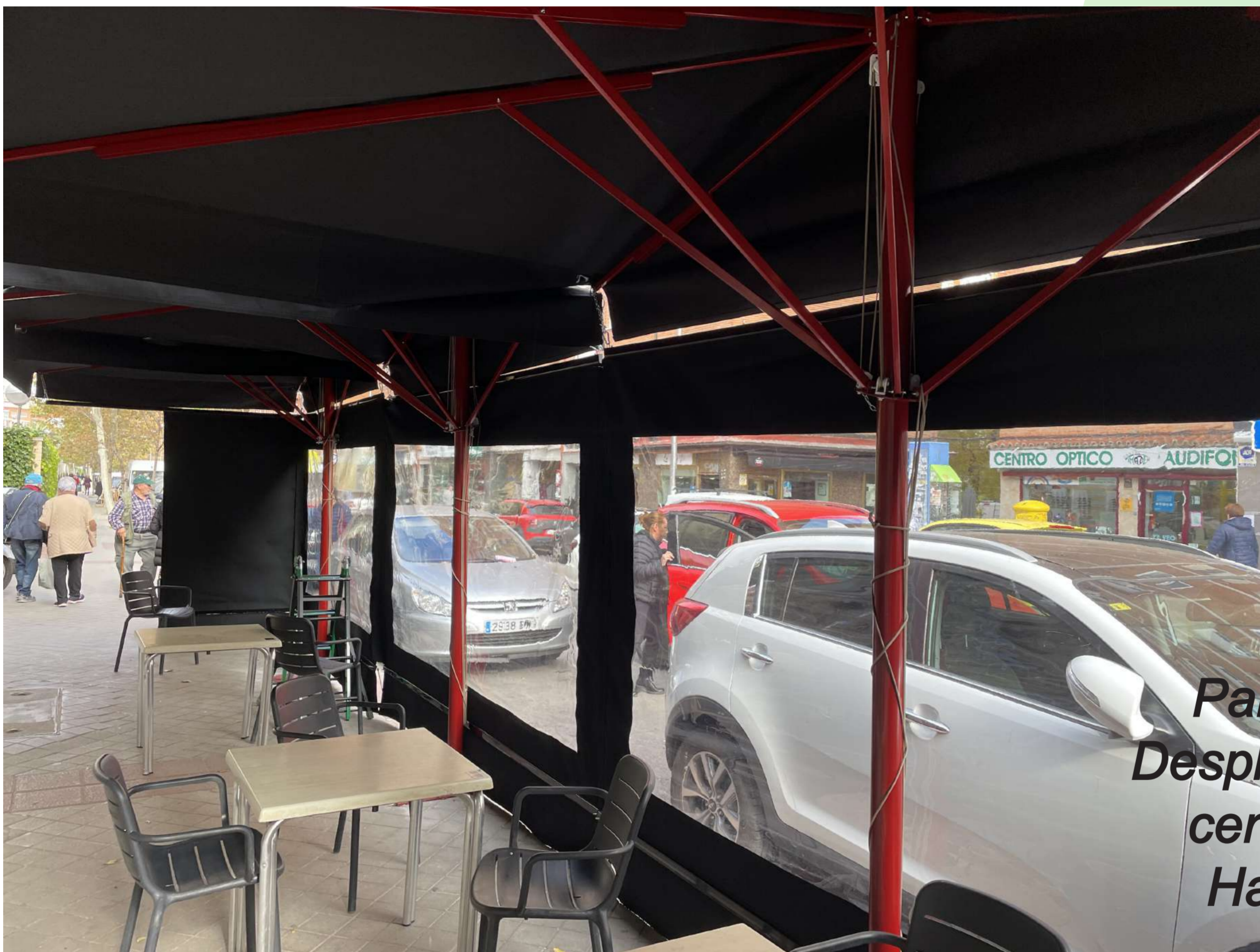
Parasol Pie Desplazado con cerramiento Hasta 9 m 2