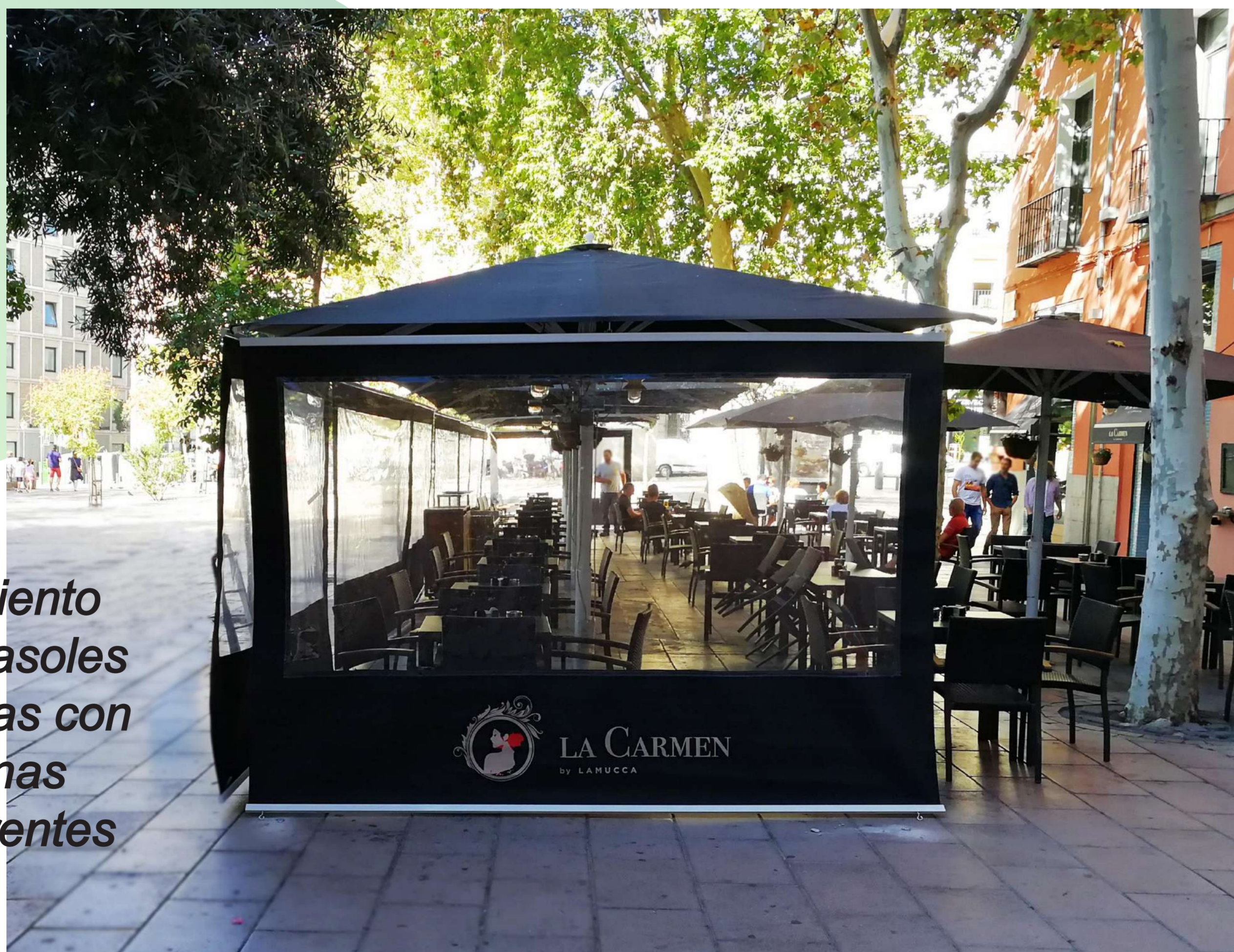
Cerramiento para parasoles de cortinas con ventanas transparentes